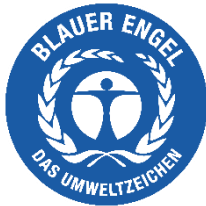
Deutsches Umweltzeichen – Der Blaue Engel: www.blauer-engel.de