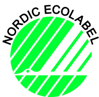
Skandinavisches Umweltzeichen – Der Nordische Schwan: www.svanen.se/en