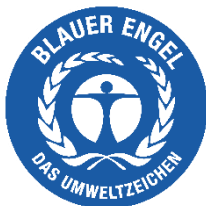
Deutsches Umweltzeichen – Der Blaue Engel: www.blauer-engel.de