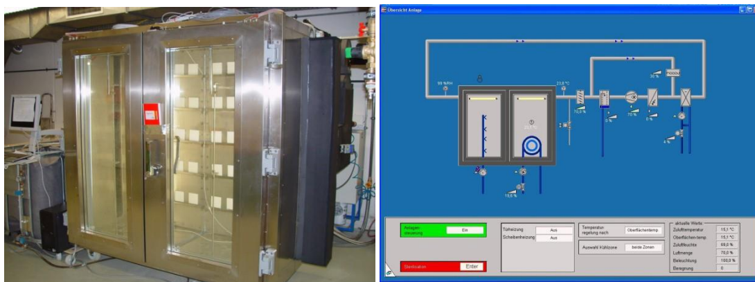
Bild.2: Photographische Ansicht der laufenden Schnellbewitterungsanlage (links) und Screenshot des Überwachungsprogramms (rechts).

Die in Bild 2 gezeigte Versuchsanlage besteht aus einer Edelstahlkammer, deren Rückwände gekühlt werden können, um die Oberflächentemperatur der darauf angebrachten Fassadenbeschichtungen unter die Taupunkttemperatur abzukühlen und somit eine Betauung der Probekörper zu erreichen. Über einen Zeitraum von ca. 8 Stunden wird der Taupunkt um 1,5 K unterschritten. Durch seitlich angebrachte Öffnungen wird entsprechend dem ausgewählten Prüfklima konditionierte Luft eingebracht. Die Beregnung der Proben mit entkalktem Leitungswasser erfolgt von vorne über Düsen. Um eine gegenseitige Kontamination der Proben durch ablaufendes Wasser zu verhindern, befinden sich unter jeder Probenreihe Ablaufrinnen. Zur Beleuchtung sind seitlich an den Türen zwei Lampen angebracht, die an den Proben im Tag-Nacht-Wechsel eine Beleuchtungsstärke von 650 Lux erzeugen.